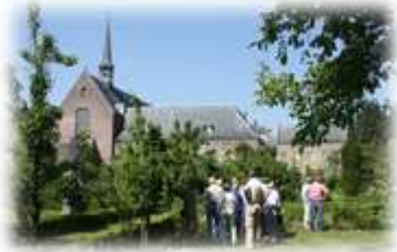
HOF VAN LOF